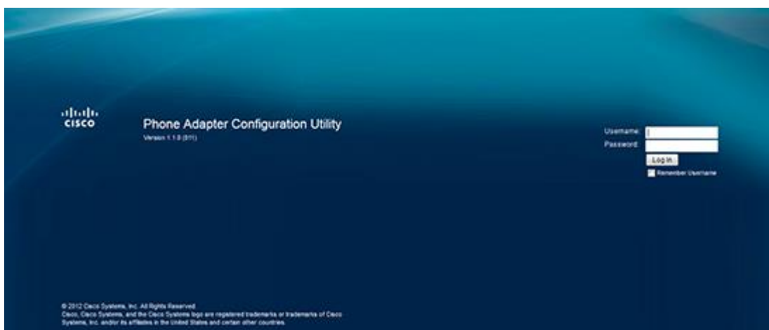
(obrázek č. 2)