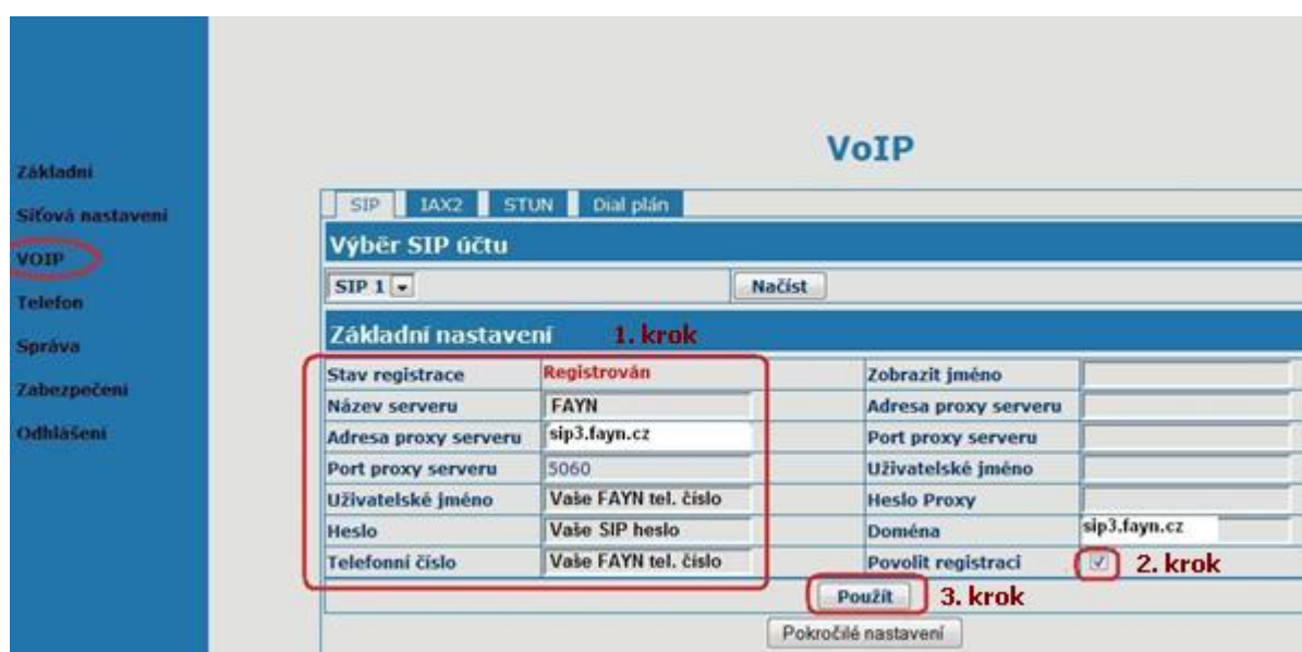
(obrázek č. 2)