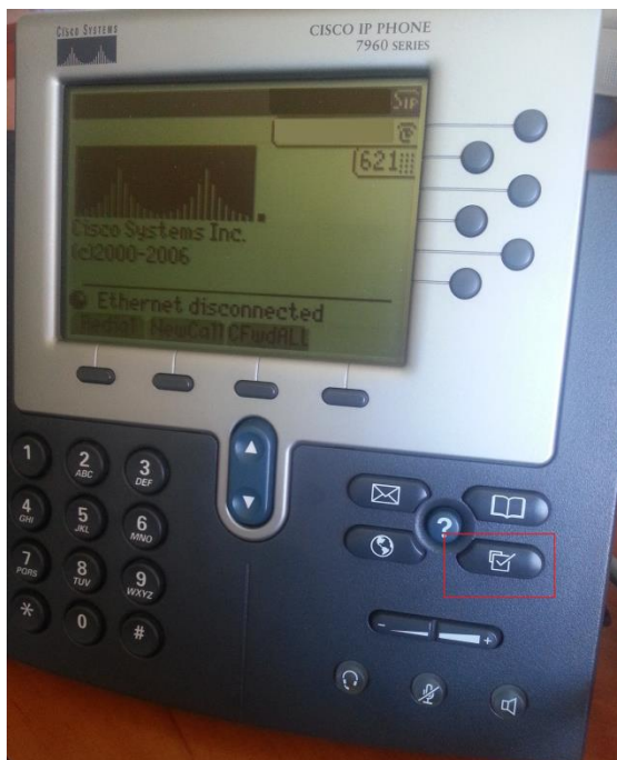
(obrázek č. 1)