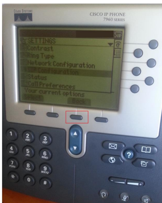
(obrázek č. 3)

4) Pro uložení nastavení stiskněte 3x tlačítko „Back“ až se dostanete na hlavní obrazovku (viz obrázek č. 3).