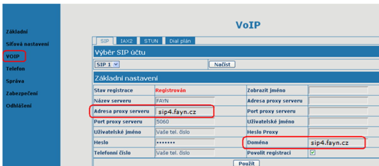
(obrázek č. 2)