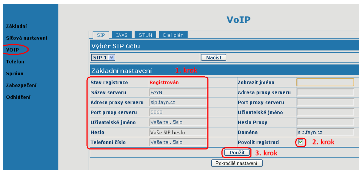
(obrázek č. 2)