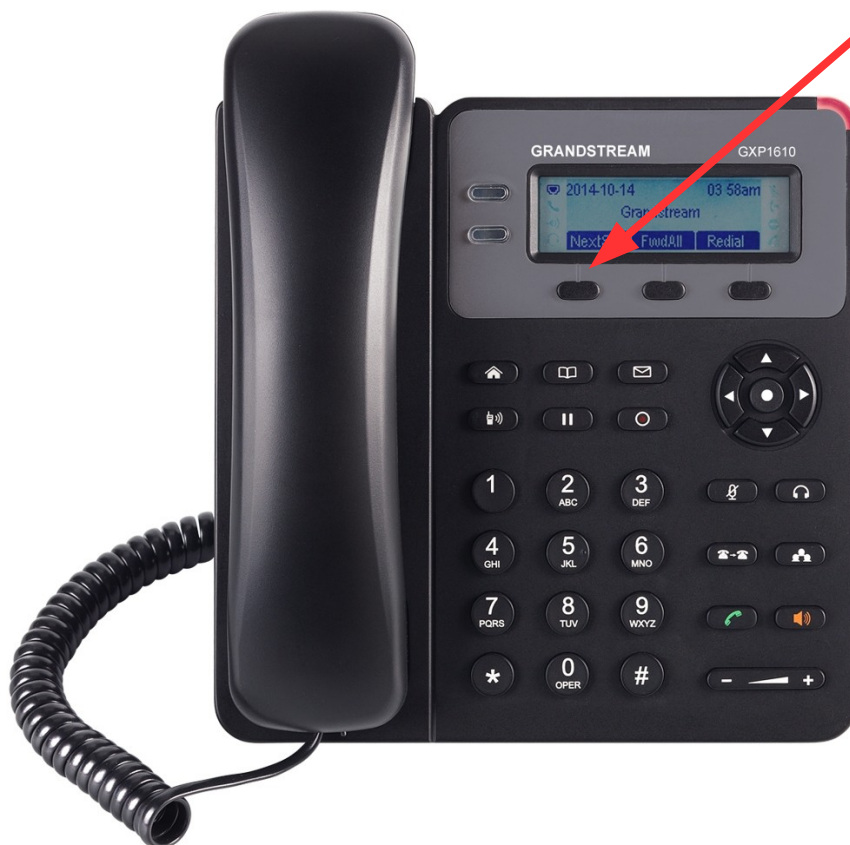
(obrázek č. 2)

Zapojte telefon podle obrázku č. 1. Pro vstup do webového rozhraní telefonu je nutné zjištění IP adresy. Pro zobrazení IP adresy na displeji Vašeho telefonu stiskněte 2 tlačítko NextScr (viz obrázek č. 2).“ př. kde se ukáže IP Address : 192.168.1.32