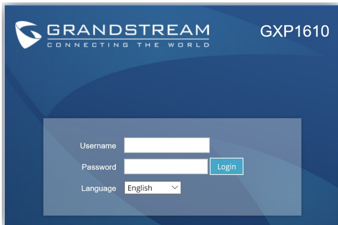
(obrázek č. 4)

Po zadání IP adresy do prohlížeče, se Vám zobrazí přihlašovací stránka (viz obrázek č. 4). Zde do prázdného políčka Username zadejte přihlašovací jméno a do Password heslo (defaultně je od výrobce přednastaven na jméno admin a heslo admin ) poté stiskněte tlačítko Login . Doporučujeme do zařízení nastavit svůj vlastní heslo a lépe jej tak chránit.